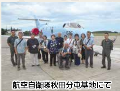
航空自衛隊秋田分屯基地にて