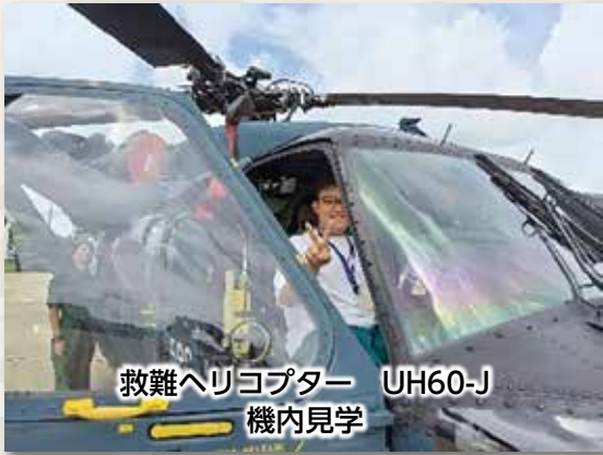
救難ヘリコプター UH60-J 機内見学