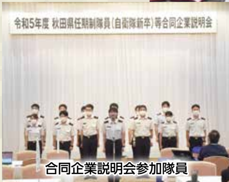
合同企業説明会参加隊員