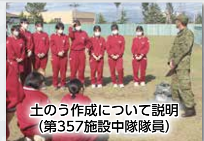
土のう作成について説明 (第357施設中隊隊員)