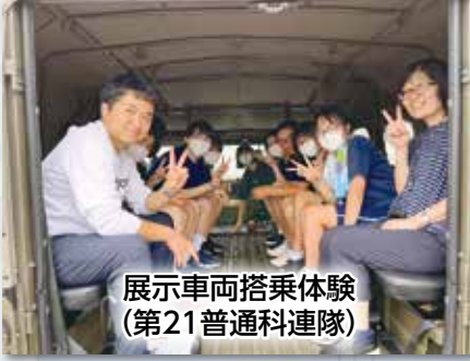
展示車両搭乗体験 (第21普通科連隊)