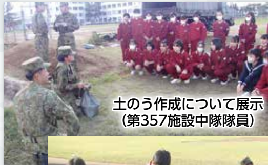
土のう作成について展示 (第357施設中隊隊員)