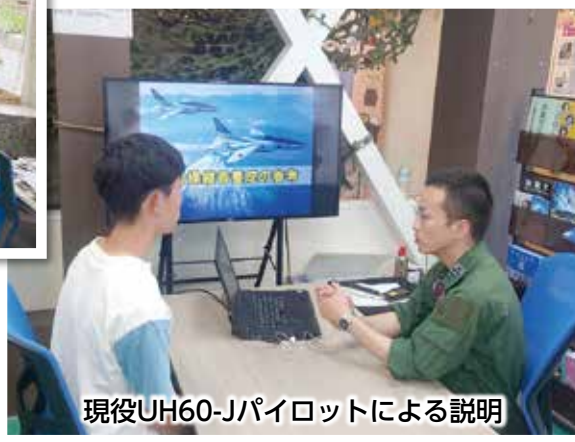
現役UH60-Jパイロットによる説明

7月1日から31日まで1カ月の期間限定で、秋田駅前緑屋ビル1階テナントにおいて、「秋田駅前募集拠点（愛称「あきた駅前BASE」）」を初めて開設しました。期間中は、広報官が常駐して高校生など来場者に対し自衛隊入隊制度の説明等を行いました。ブース内には陸・海・空自衛官の制服や装備品の展示、体験コーナーでは実際に宿営用天幕を展覧し、その中での疑似野営体験や制服の試着体験、屋外には自衛隊車両の展示など自衛隊を直接肌で感じられる工夫により、たくさんの方々のご来場をいただきました。