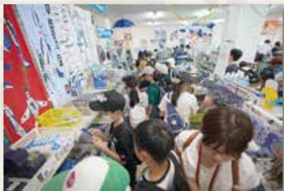
PX(売店)にてグッズの購入