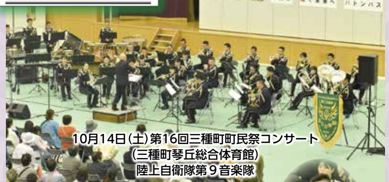
10月14日(土)第16回三種町町民祭コンサート (三種町琴丘総合体育館) 陸上自衛隊第9音楽隊