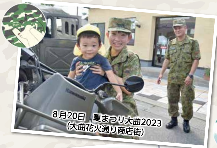
8月20日 夏まつり大曲2023 (大曲花火通り商店街)