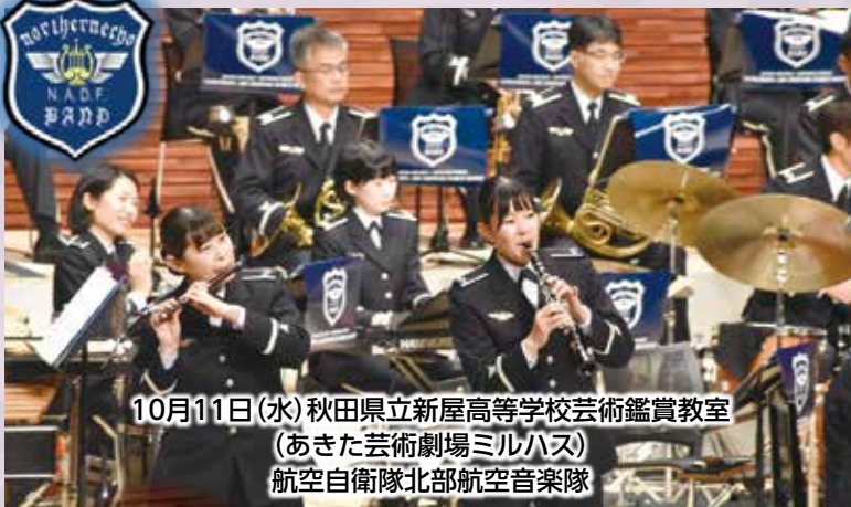
10月11日(水)秋田県立新屋高等学校芸術鑑賞教室 (あきた芸術劇場ミルハス) 航空自衛隊北部航空音楽隊