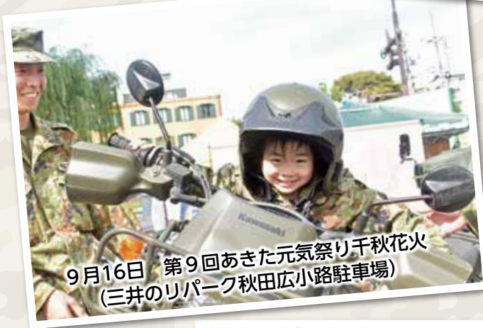
9月16日 第9回あきた元気祭り千秋花火 (三井のリパーク秋田広小路駐車場)