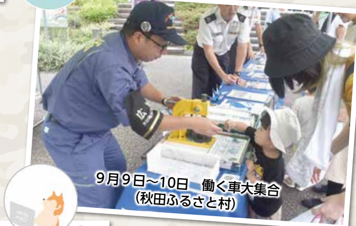
9月9日~10日 働く車大集合 (秋田ふるさと村)