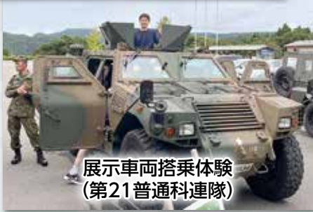
展示車両搭乗体験 (第21普通科連隊)