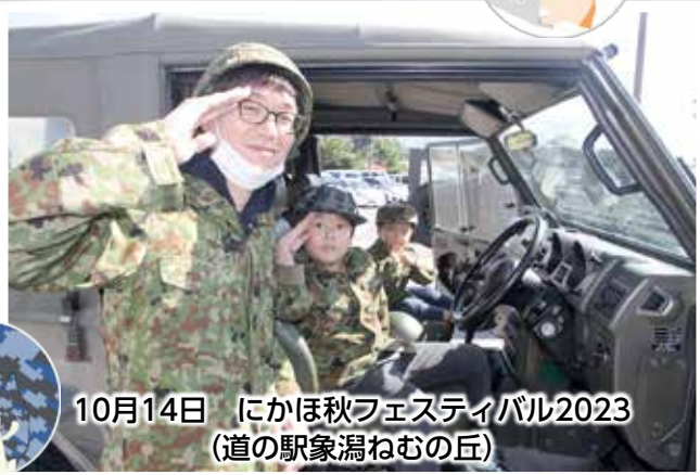
10月14日 にかほ秋フェスティバル2023 (道の駅象潟ねむの丘)