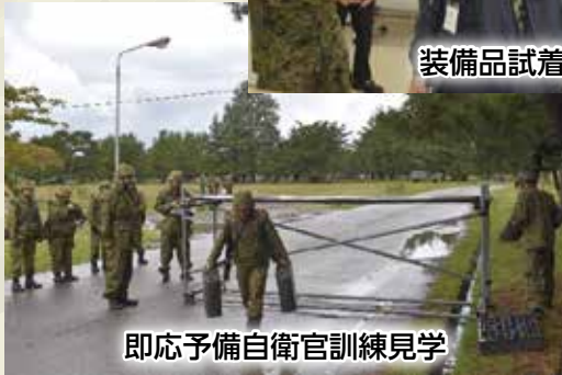
即応予備自衛官訓練見学