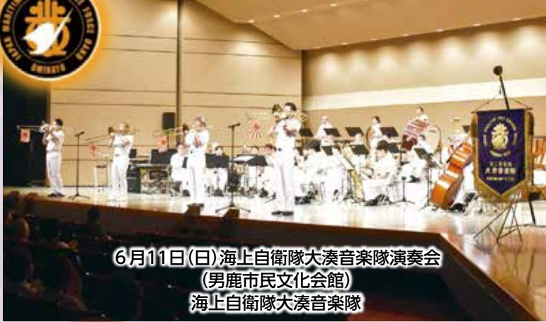
6月11日(日)海上自衛隊大湊音楽隊演奏会 (男鹿市民文化会館) 海上自衛隊大湊音楽隊