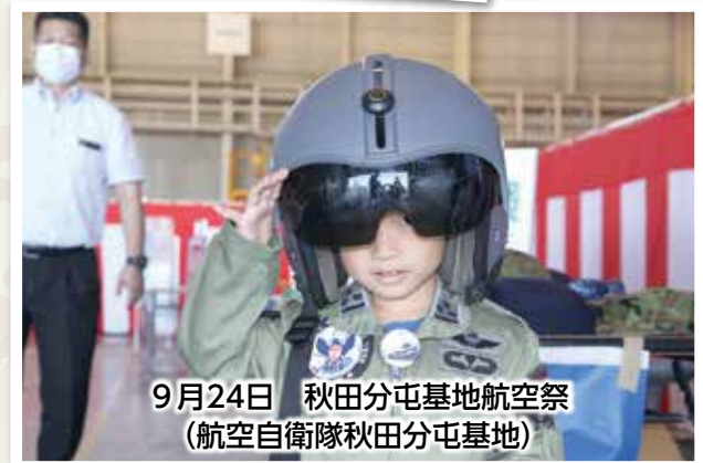
9月24日 秋田分屯基地航空祭 (航空自衛隊秋田分屯基地)