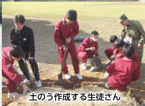
土のう作成する生徒さん