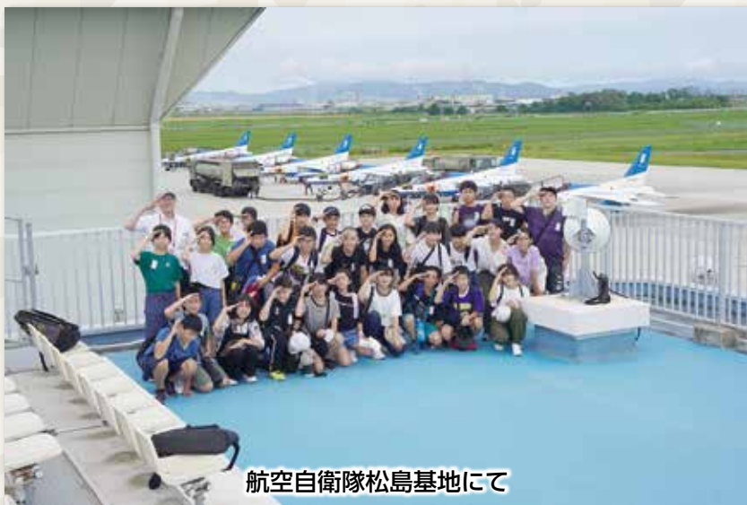
航空自衛隊松島基地にて