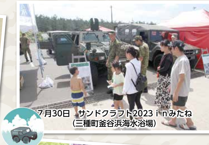
7月30日 サンドクラフト2023 in みたね (三種町釜谷浜海水浴場)