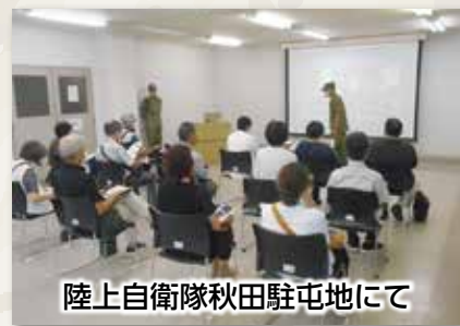
陸上自衛隊秋田駐屯地にて

9月14日、航空自衛隊松島基地において、由利本荘市立小友小学校の基地見学を支援しました。