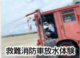
救難消防車放水体験