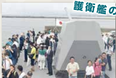
護衛艦のしろ一般公開