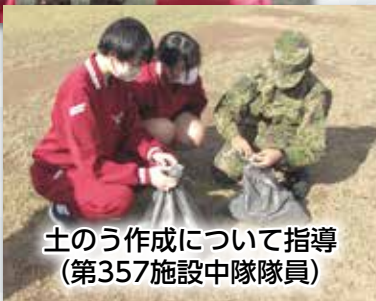
土のう作成について指導 (第357施設中隊隊員)