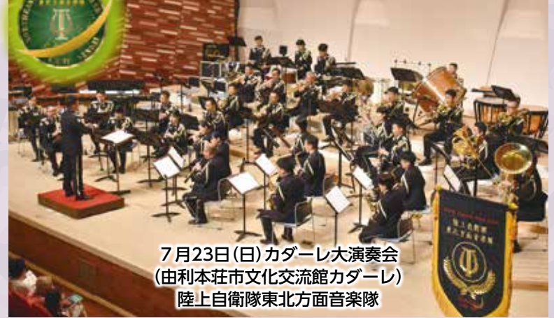
7月23日(日)カダーレ大演奏会 (由利本荘市文化交流館カダーレ) 陸上自衛隊東北方面音楽隊